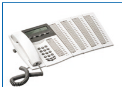
Aastra Dialog 4000 Digital Telephone