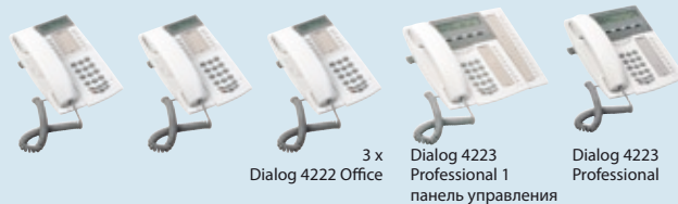
3 x Dialog 4222 Office Dialog 4223 Professional 1 Dialog 4223 Professional панель управления