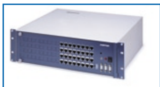
Aastra BusinessPhone 128i