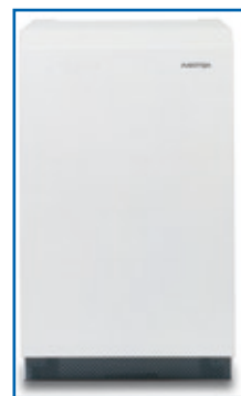
Aastra BusinessPhone 250