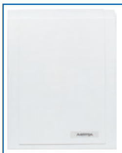
Astra BusinessPhone 50

Центральная система включает от одного до трех корпусов с креплением на стене. В каждом корпусе имеется девять гнезд для плат, способных обслуживать от 20 до 200 абонентов (300 для специальной системы Hospitality). Все корпуса имеют встроенные трансформаторы. Кроме того, можно подключать резервный блок питания или альтернативный источник питания постоянного тока.